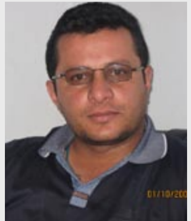
شمال مدههد بهرچی

گه ندهلی ئەو دیاردا مه ترسی داره یا کو لسه رانسهری جیهانی بهر به لاق و بتاییهت ل وهلاتین ئیسلامی وعه ره بی وروژه هه لاتا ناغین بگشتی، گه ندلی ب پیناساخو واته خراب ب کارئینانا مال ومولک ودهسه لاتا گشتی بوبه رژه وه ندیین تاییهت، هه لبهت زور جوړین گه ندهلین هه نه ژوانا یا کارگیری و یا داریی ویا ره وشه نبیری وجفاکی و سیاسی ....تا دزور کهس هوسا تی دگه هن کو گه ندهلی بتنی یادارایی یه چونکو بهه را پتر باس لوی دهیته کرن، لی بتنی گه نه لیا دادگه هی ب مه ترسی دارترین جوړ دهیته نیاسین چونکو کارتیگرا وئ زوره و یانگه تیغه ل سه ره می چین وتویژین گومه لگه هی و ئەف