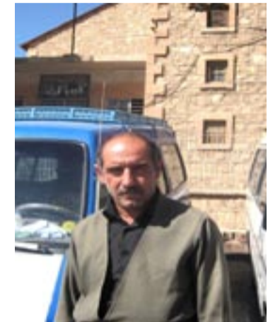
وماوی ب جه ئینانا پروژهی (۱۰۰) روژن.

هاتیه دانان بو (قونتهرچیهکی) ب ریکا سهرک زیدهکرئی برهخ پرا شوروشقه . ژبو کیم کرنا قهرهبالغی دناف سهنترئی باژیری دا، ئەف گهراجی نوو دی ئیتیه تهرخانکرن بو هیلین (فهیدیی و دویمیز وتنهاهی ومالتا ژوری وژیری ، زرکا ودگهل تاحی شههیدان وگری باسی وتاحی رهزا ویدیاری) ، روبهری فی گهراجی (۲۰۲۶م)، ئەف گهراجی بو ماوی دهه سالان دی ب قونتهرچی بیت ژپیش ههر سالهکیفه ئەو دی (۳۳۵) ملیون دیناران دهته باژیرفانیا دھوکې