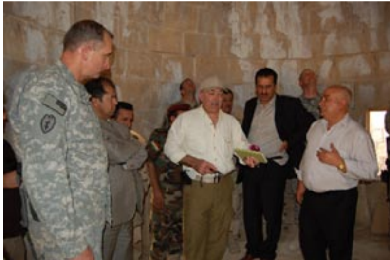
ناها ت - نامیدی

پیشمه رگی ل مووسل و هژماره کا بهرپرین حزبی و له شکر د روونشته کی دا بهرپرین لښکر به حسی ده قرا نامیدی ژلای جوگرافی و دیروکی و ئابوری و جفاکی کر، و ئالیین گشت و گوزاری به حسی کرن و جه نه رالی گوت : نه م دئ بزاقی کهین هاریکاریین دگل هه وه بو پیشدابرنا ده قری. لدووقدا سه رهدانا شوونه وارین که لا نامیدی کرن.