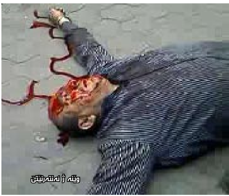
ويته ژ له ټه ريژي

ل روژا ٢٠٠٨/١٢/٢٦ تومه تباري ب نافي (ف. د. ه) يي د ژبي ٢١ ساليي دا گه نه كې دي يي ب نافي (م. س. م) ل قهزا زاخو دايه بهر ساتوران، تومه تباري نافرې دبيژيت: (من قهستا دوكانا وي كر، ټه ز يي سه رخوشبووم من چوار قوديكين مه يي ژ جوړي (بيره) قه خواربوون د ټه گه ري دا ټه ز ژ دوكانا خو دهر ټيخستم و قه سين نه خوش گوټنه من، ټه ز ژي گه له ك توره بووم و من هاي ژ خو نه بوو ژ بهر كارتيكرا مه يي د ټه گه ري دا من هند ديت كو ساتوره ك يا د دهستي من دا، لي بي را من ناهيته كو من ساتور يا ل سهري وي داي، به لي من ټيك ل ته نشتا وي دا بوو، ههروه سا وي ژي كوله ك ل دفنا من دا بوو.)