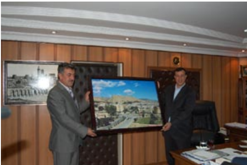
دوو په نه لاندا. په نه لهک لدور ريفه برنا باژيرقانيان کو سروکي شاندي

شاندي دقي سهره دانې دا سورا (۱۰) باژيرقانيان دا ژوان ژي سلوپيا- جزيرئ- سورا نامه دي باژيرقانيا نو ل نامه دي- باژيرقانيا باغلهه- باژيرقانيا کايپنار ل نامه دي- باژيرقانيا مهزن ل نامه دي- باژيرقانيا باتماني- باژيرقانيا گرجوش ل قان سهره دانان بهحسي گهلهک مژاران هاتکرن نهوين گريدي ب پلان و پروژين خزمهتگوزاري ديسان شاندي پشکاري د فورما مهزوبوتاميا يا جفاکي دا کر د