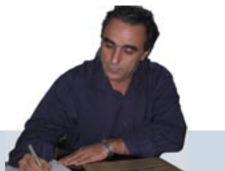
ژ نقیسینا عادل دهنر