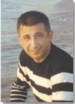
نہ تہ کیت یاسین