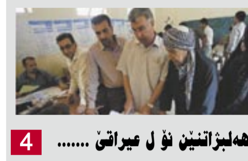
4 هه لبراتی نئ ل عیراتی .....