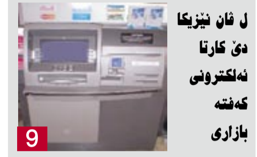
9 ل شان نیریکا دی کارتا نه لکترونی که فته بازاری