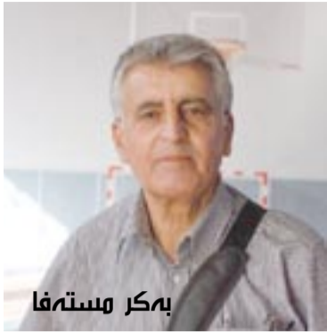
بکر مسته فا

نه یا دورست بوو ئەم یاریی ل سه ر بکه یین چونکو ئاستی مه ئینا خوار، دادقانیین یاریی تا نوکه د سه رکه فتی نه د بریارین خودا ل دووف یاسایا یاریی دچن.