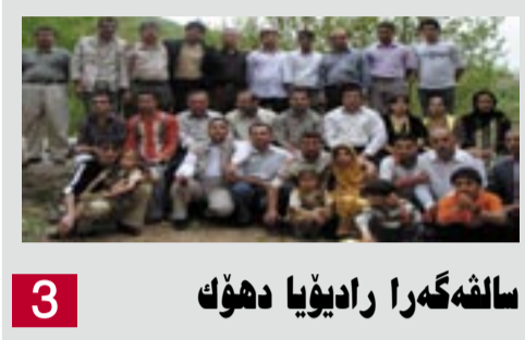
3 سافه گه را رادیویا ده وک