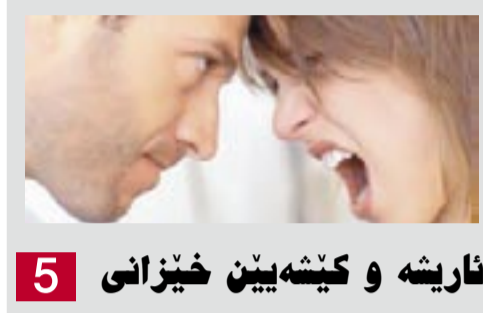
5 ناریشه و کیسه یین خیزانی