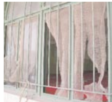
دویچوون: خابور و بورهان

(مه لا محمه مد علی تاها سگری) مه لای مزگفتا (ابن الاثیر) ل ناخی سهرهلدان سه بارهت فی بابته دبیژیت: ل روژا شه می ریکه فتی ۱۰/۸ ئەز ل تازیکی به رهف بوم ول دهمی ئیقاری زفریمه مزگفتی ژلای نغیزکه ران فه بۆمن هاتگوتن کو پشتی نغیزا نیفرۆ و گرتنا دهرگه می مزگفتی؛ کهسهک ل سهر دیواری را هاتیه د ژورقه و پاشی په نجهرک شکانديه وتیلا وی درانديه وخو گه هاندیه قاسی کو د ناف مزگفتی دا بوویه. مه لا محمه مد کو زور یی دلگران بوو به ردهوام دبیت و دیاردکر کو: گهلهک جارن